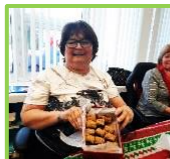
Activité de photobooth de Noël avec les participantes de Saint-Luc Des participantes ont reçu des sucreries lors de l'échange de cadeaux