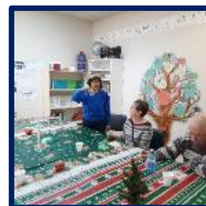
Diner, bingo et chasse au trésor pour les groupes du Lac-Etchemin